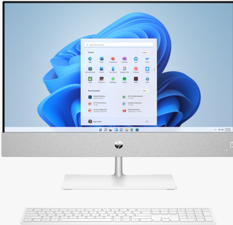
*Das Produktbild kann vom tatsächlichen Produkt abweichen

Der HP Pavilion All-in-One bietet dir alles, was du brauchst. Ein Desktop für höchste Produktivität beim Streamen und Spielen, mit flimmerfreiem 1 Display und einer atemberaubenden Audiowiedergabe. Der Blaulichtfilter schützt bei längerer Nutzung deine Augen und die Privacy Camera mit Popup-Funktion ist ideal für Videoanrufe 2 . Triff eine umweltbewusste Entscheidung dank nachhaltigem Design 3 .