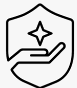
3 Jahre Abhol- und Lieferservice U4819E