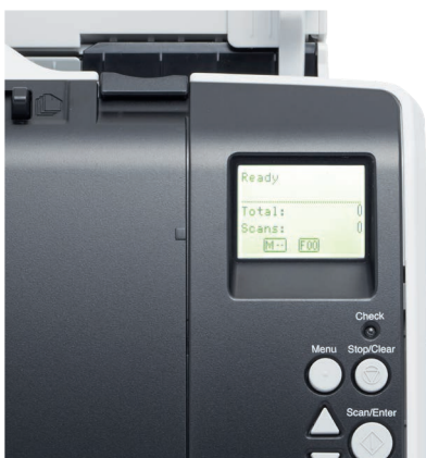
LCD-Bedienfeld mit integrierter Hintergrundbeleuchtung

Ein LCD-Bedienfeld mit Hintergrundbeleuchtung zeigt Informationen wie aktuelle Scannereinstellungen, Betriebsstatus sowie einen Blattzähler. Das Auswählen vordefinierter Routine-Scanvorgänge - die mit der integrierten, leistungsstarken PaperStream Capture-Lösung erstellt wurden - ist kinderleicht.